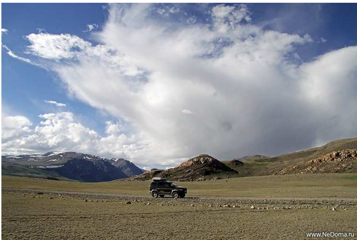
Дорога к селу Мугур-Аксы