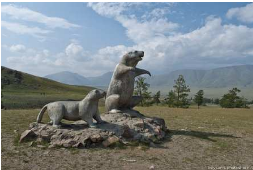
Сурки в скульптуре-. Село Мугур-Аксы (Республика Тыва , Россия)

Есть аэропорт, куда раза три в неделю прилетают вертолеты или самолеты из Кызыла. Местной достопримечательностью считается озеро Хиндиктиг-Холь ("пуп земли"), получившее это название из-за острова с высокой горой посередине (отм. 2458 м). Всего островов два. На них водится черный сурок - тарбаган и растут лечебные травы. В озере много рыбы, причем крупной. Есть база для рыбаков. Вокруг еще пять озер.